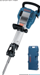
GSH 16-28 Professional